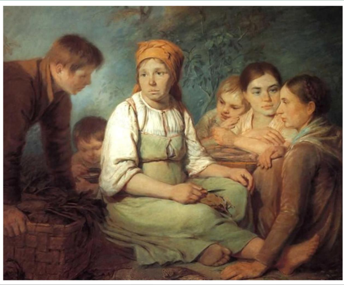
Венецианов А.Г. Очищение свеклы 1822

Посмотри на картину. Как ты думаешь, какие функции семьи проиллюстрированы?