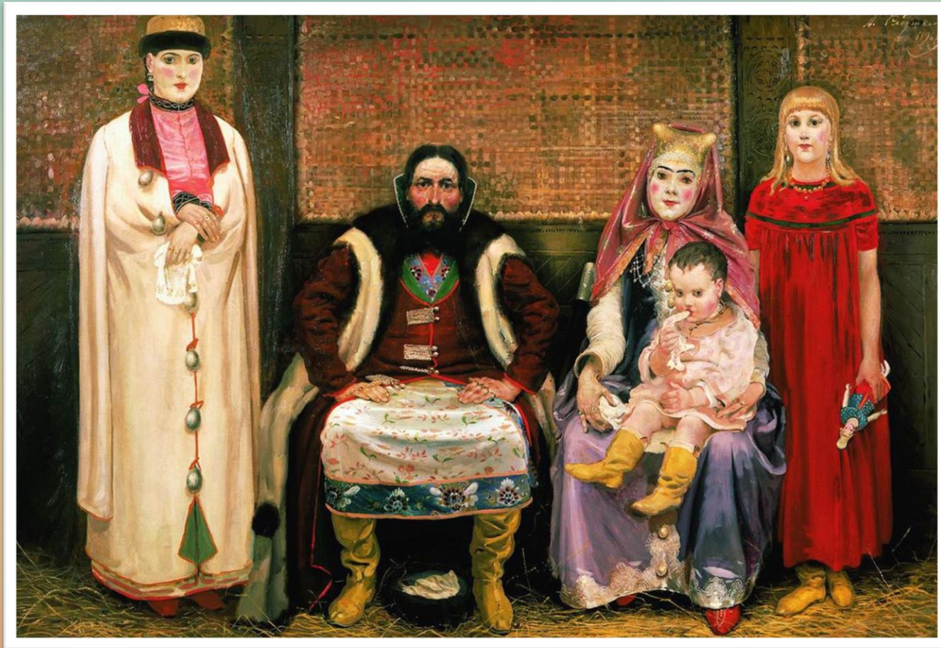
Рябушкин А.П. Семья купца в XVII веке 1896

Посмотри на картину. Как ты думаешь, какие функции семьи проиллюстрированы?